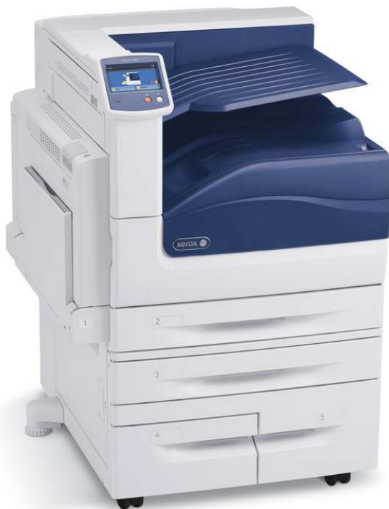
Xerox Phaser 7800