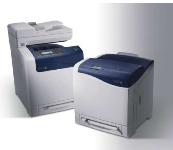
Xerox WorkCentre 6500 / 6505

Mezi první z novinek patří barevné tiskárny Phaser 6000/6010/6500 a jedna multifunkce Xerox WorkCentre® 6505. Phaser 6000 a 6010 patří v současnosti mezi nejmenší a nejlehčí barevné tiskárny na trhu a nabídnou rychlost tisku až 12 str./min. barevně, resp. 15 str./min. černobíle. Tisknou na širokou škálu materiálů a rozměrů, od samolepících štítků, přes listky do kartotéky až po obálky. Oba modely již jsou na českém trhu dostupné, koncové ceny se pohybují okolo 4000 Kč bez DPH. Phaser 6500 a multifunkce WorkCentre 6505 disponují rychlostí tisku až 24 str./min. v barvě i černobíle, vstupní zásobník má kapacitu 500 listů. Vysokokapacitní tonerové kazety produkují až o 80 % méně odpadu v porovnání se srovnatelným barevným zařízením. Cena těchto modelů začíná na 8500 Kč bez DPH. Multifunkční zařízení WorkCentre 6505 umožňuje – kromě samotného tisku – také kopírování, skenování a faxování. K optimalizaci správy dokumentů slouží nástroje jako skenování do e-mailu, síťové skenování, přímý sken do aplikací, včetně optického rozpoznávání znaků (OCR) nebo skenování na připojené USB zařízení. Použitý toner, vyrobený technologií emulsního agregování, v kombinaci s rozlišením 600 x 600 x 4 dpi pomáhá tvořit ostřejší text a hladké barevné přechody.