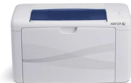
Xerox Phaser 3040