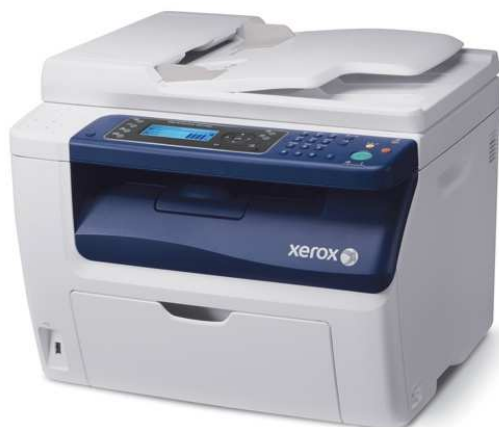
Xerox WorkCentre 6015

Koncem ledna 2012 uvedl Xerox oficiálně na trh novinkové modelové řady Phaser 3010/3040, 6000/6010, 6500, 7800 a WorkCenter 6505/6015 a 3045. Jedná se o tiskárny a multifunkce, které nabídnou jak výrazně menší proporce, tak i příklon k fotografickému segmentu. V neposlední řadě novinky potěší nízkou pořizovací cenou i náklady na tisk, a samozřejmě (v dnešní době stále aktuálnější) nízkou ekologickou zátěží. Představené tiskárny pracují na principu LED tiskové technologie, spadají do segmentu malonákladového tisku a mohou nabídnout malým i středním podnikům profesionálně vyhlížející dokumenty bez přehnaných nároků na rozpočet.