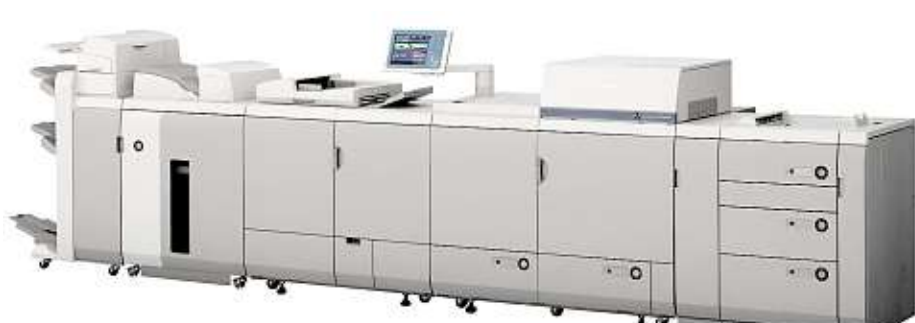
Canon na stánku poprvé v České republice představí produkční tiskový stroj imagePRESS C6010 ve spojení s tiskovým serverem Creo.

Novinkou bude řízení digitálního výseku a řezání také z tohoto RIP prostředí. Toto pracoviště tak poskytuje i případnou hromadnou