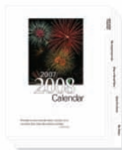
Rozřazovače s oušky