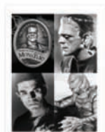
Složky nebo brožura V1