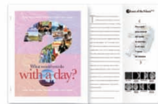
Barevné vložené listy, sešívání a skládání technických výkresů

Naše kopírka/tiskárna vám dává více možností. Vytvářejte nyní i v budoucnosti inovativní aplikace generující obchodní příležitosti.