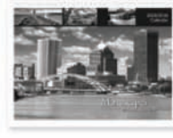
Děrování pro kalendářovou/ spirálovou vazbu