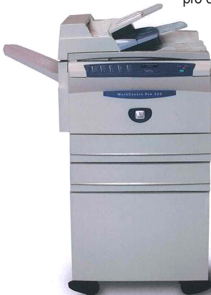
WorkCentre Pro 420 Tiskárna - kopírka