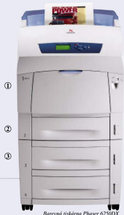
Barevná tiskárna Phaser 6250DX

Ekonomická a rychlá automatická duplexní jednotka pro oboustranný tisk (standardní na konfiguracích DP, DT, DX).